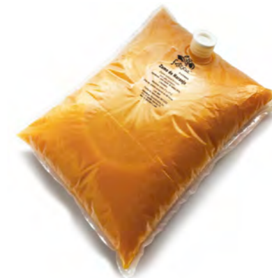
Formatos profesionales 5 Litros