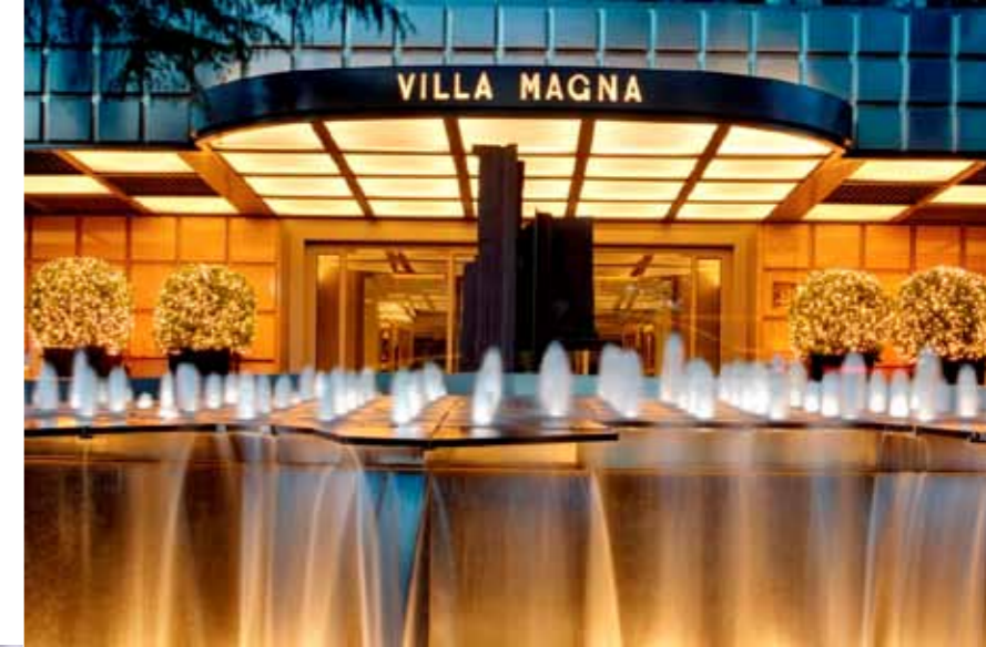
Hotel Villa Magna - Madrid