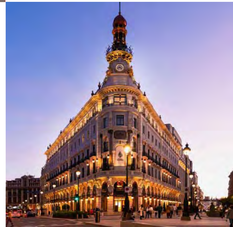
Hotel Four Seasons - Madrid