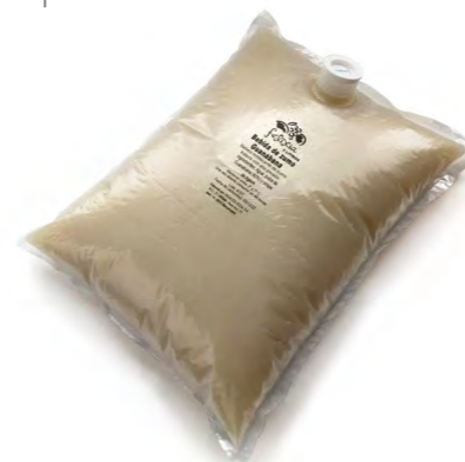
Formato profesional 5 Litros