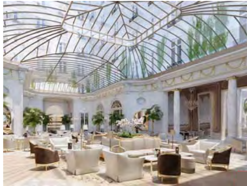
Hotel Mandarin Oriental - Ritz Madrid

Las mejores cadenas hoteleras y los hoteles más emblemáticos confían en Felixia para ofrecer a sus clientes una experiencia única, como lo son ellos mismos.